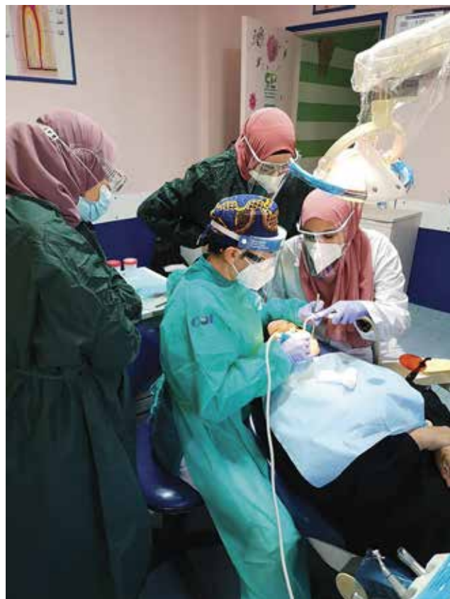
Libano - Formazione COI in ambulatorio